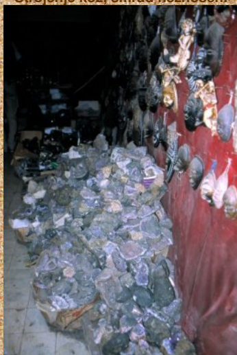
Nespoštljiv odnos do mineralov ?

Nadaljevali smo preko gorovja Rif, in se v mestu Tetouan prvič ustavili, da bi si malo поблиže ogledali staro mestno središče. Medina imenujejo center z ozkimi ulicami, kjer je vedno zelo živahno. Tu se proizvajajo izdelki domače obrti, katerih surovine so, usnje, les, kovine, volna,... . Posebnost tega mestnega jedra, je v tem, da se tu tudi vse prodaja. V ta sklop sodi še tržnica, ki je povsod v arabskem svetu zelo slikovita. Različne vonjave od raznovrstnih začimb, duh po kožah v obdelavi, in neurejena kanalizacija dajejo popotnikom v svežih majicah mešane občutke. Na srečo vse to ne traja dolgo. Majice se oznojijo, vrvežu se človek s črednim nagonom privadi, in kmalu je del njih.