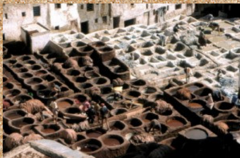
Strojenje kože, smrad neznosen.