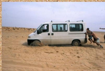
Včasih je premalo konjskih moči.

Konec septembra se nas je osem nekako tako mislečih, s kombijem podalo na pot v Maroko. Žal sva bila med njimi » kamenjarja » samo dva in to ni bilo vedno najbolje. Dežele Italijo, Francijo in Španijo smo prevozili v enem kosu ( 30 ur ), in si jih ogledali samo skozi okno avtomobila. S trajektom preko Gibraltarske ožine, smo v petinštiridesetih minutah pristali na afriških tleh. Španci so si, praktično v Maroku, obdržali košček zemlje Cevto, ki je sedaj brezcarinska cona in se maroška država prične šele izven nje. Mejne formalnosti smo hitro opravili, malo tudi s pomočjo domačina, ki pa je na koncu zahteval plačilo. Dvajset dirhamov , sicer ni bilo veliko, a dobra šola za naprej.