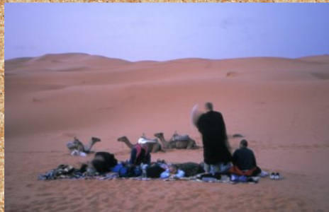
1001 noč v puščavi.

Dalje smo okusili tudi malo piste, to je puščavskega brezpotja. Po malo prepiranja smo za to smer le vzeli vodnika. Merzouga je bilo naselje kjer se je kamnita pista nehala in so bile naprej samo še sipine. V njihovo prostranstvo je možno prodirati samo še na kameljem hrbtu. Tudi nekaj tega smo si privoščili, in ni nam bilo žal. Proti večeru smo odjezdili v smeri vzhod. Kmalu se je stemnilo, in ježa na kameljem hrbtu ponoči je še posebno doživetje. Na pobočju ne vem katere sipine smo se ustavili, in vodnik je v pesek pometal odeje, ki so nam preje služile za sedla. To je bila to noč naša spalnica. Četudi človek ki se nima za romantika, v taki noči nebi začutil nekaj tega, je potem z njim nekaj hudo narobe. Noči v puščavi se ne pozabi nikoli, lahko mi verjamete, imel sem srečo, da sem to že nekajkrat doživel.