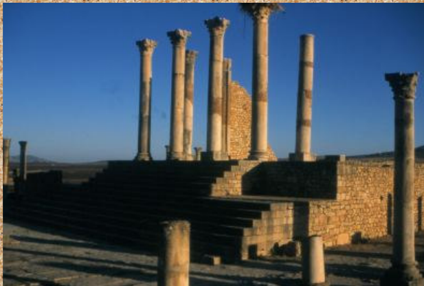
Ostanki Volubilisa (rimska naselbina).

Tudi mi smo nadaljevali pot do Meknesa, si spotoma ogledali razvaline rimskega mesta Volubilis. Pravzaprav je odkopana in restavrirana le polovica naselbine zgrajene okoli leta štirideset. To je bila najjužnejša utrdbo takrat cvetočega Rima.