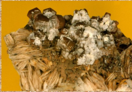
Vanadinit na baritu