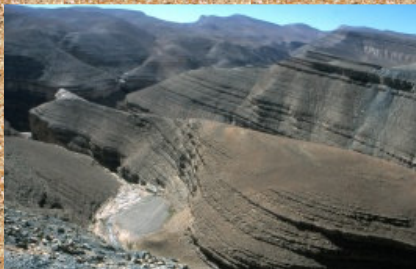
Motiv s soteske Dadas.