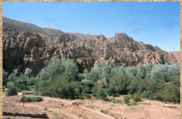
Botno puščavsko rastlinje.

Med nadaljnim potepanjem smo si ogledali še dve soteski, Todra in Dadas, ter se po mestu Quarzazate preko prelaza Tizi - n - Tichka spustili proti Marakešu.